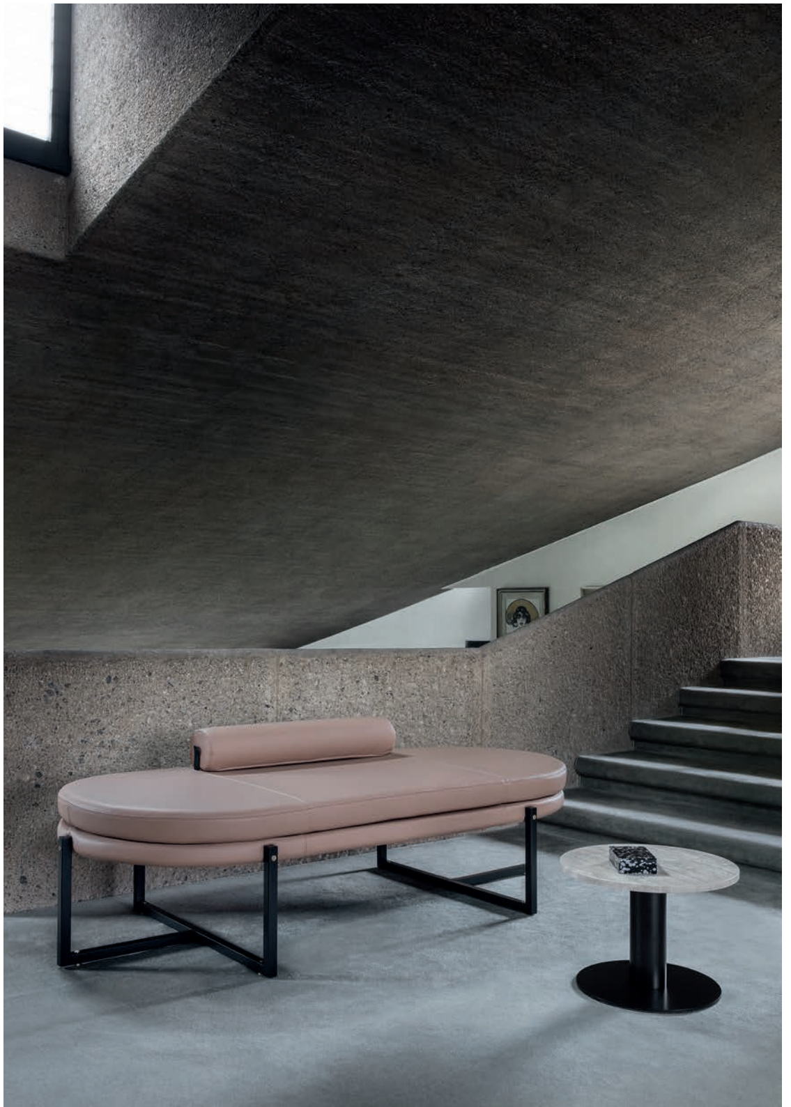
Sigmund daybed Goya small table