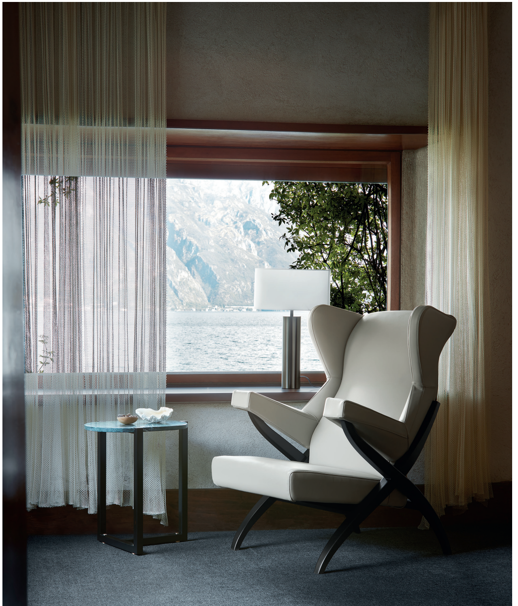
Fiorenza armchair Sigmund small table