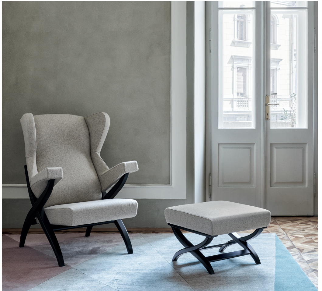
Fiorenza armchair Pouf